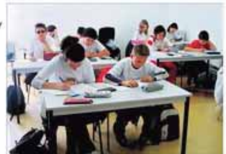
Alumnos participando en una Olimpiada de Matemáticas.

La presencia de distintos especialistas en diversas áreas, así como la participación de padres está pensada para compartir experiencias y resaltar los mejores modelos que se han de generar alrededor de los menores para potenciar su motivación y elevar su exigencia. Unas jornadas que finalizarán con la elaboración de unas conclusiones.